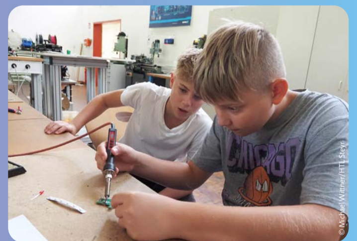
Bei verschiedenen Workshops lernen interessierte Schüler bei den Ferienwochen Schwerpunktthemen der HTL Steyr kennen.

Das Interesse an der Technik und Spaß an gemeinsamen Aktivitäten fesselt den Nachwuchs, der eine der beiden beliebten, jährlich stattfindenden Ferienwochen Create&fun und Technik&fun in der HTL Steyr besucht. Zudem freuen sich Mädchen und Buben darauf, Freundschaften zu knüpfen oder zu vertiefen. Gestartet wurde in der ersten Ferienwoche mit Create&fun für Kinder von neun bis elf Jahren. Vormittags standen kreative Aktivitäten mit künstlerischem Gestalten, Basteln eines Holzgimmicks, Rätseln und einer Coding-Challenge auf dem Programm. Der Nachmittag gehörte Outdooraktivitäten. Geplant waren unter anderem Sport, ein Badeausflug und eine Fahrt mit dem Drachenboot. Technik&fun wird jedes Jahr in der zweiten Ferienwoche für 12- und 13-Jährige angeboten. Dabei lernen Interessierte bei verschiedenen Workshops alle Abteilungen der HTL Steyr kennen. Im Mittelpunkt stehen die Themen Programmieren, Fahrzeugtechnik, 3D-Druck, Elektronik, Schmuck und Kunstschmiede. Am Nachmittag finden abwechslungsreiche Outdooraktivitäten statt.