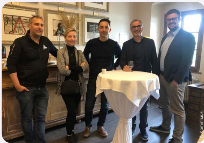
Zum Strategieworkshop gehörten auch anregende Gespräche in den Pausen.