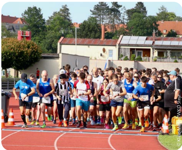
Die Hobbysportlerinnen legten jeweils sechs Kilometer auf der Rennbahnsportanlage in Steyr zurück.

Rund 110 Laufsportfreunde nahmen Anfang Juni 2024 am 7. IT Experts Run teil.